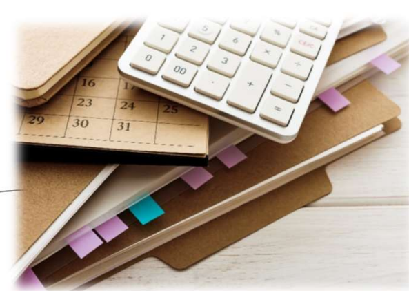
Tableau des professions par carrière