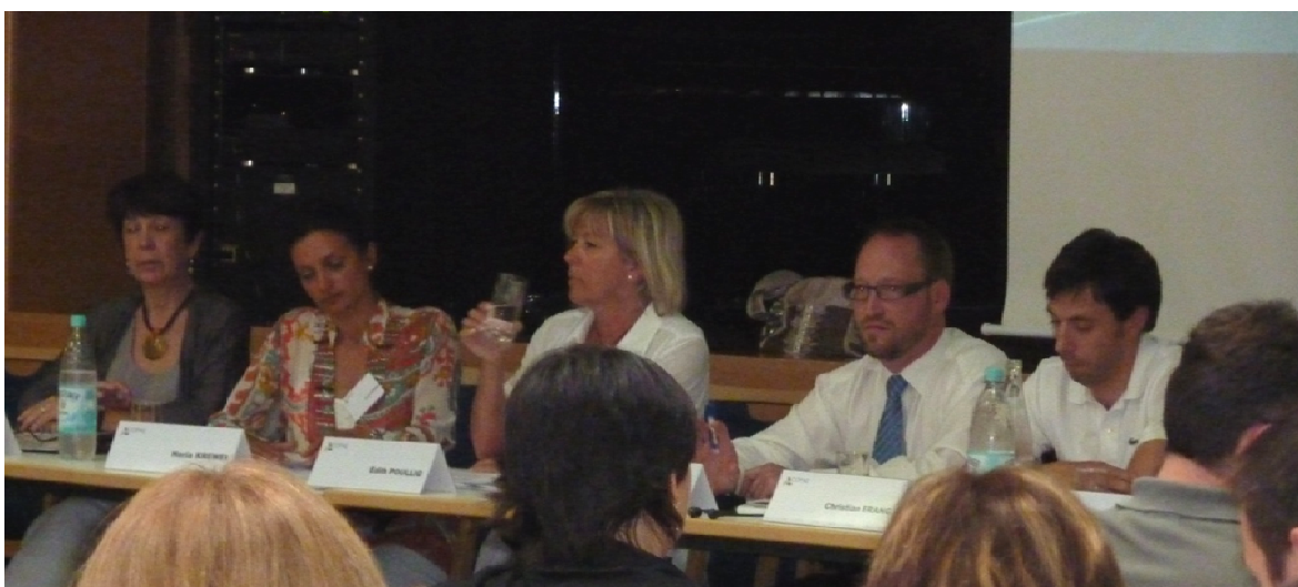
Table-ronde, conférence 19 mai 2011