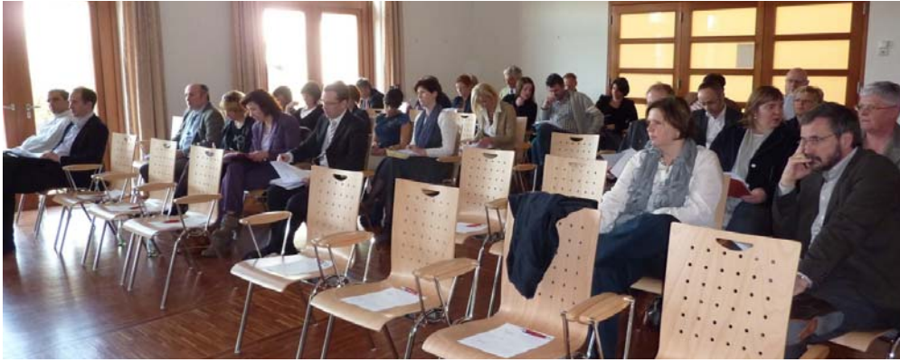
Assemblée générale ordinaire du 24 mars 2011