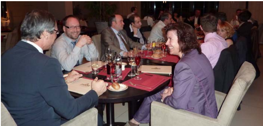
Repas suite à l'assemblée générale du 24 mars 2011