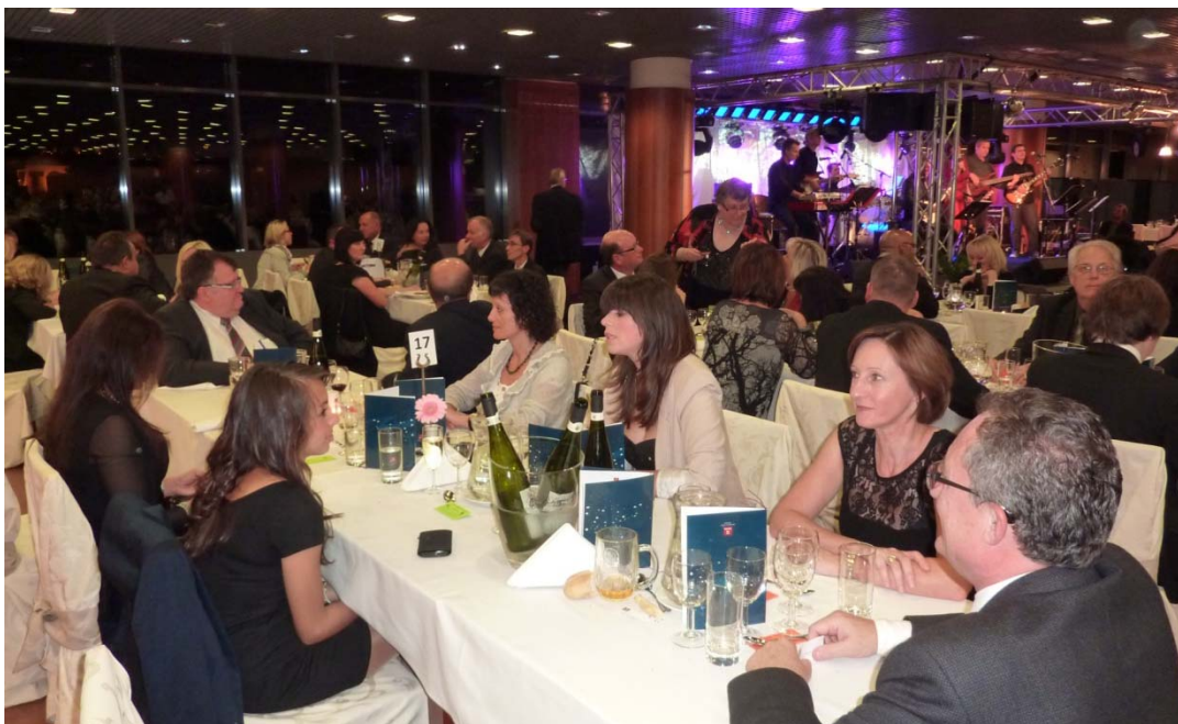
Conférence EDE, Prague, Octobre 2011