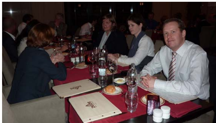
Repas suite à l'assemblée générale du 24 mars 2011