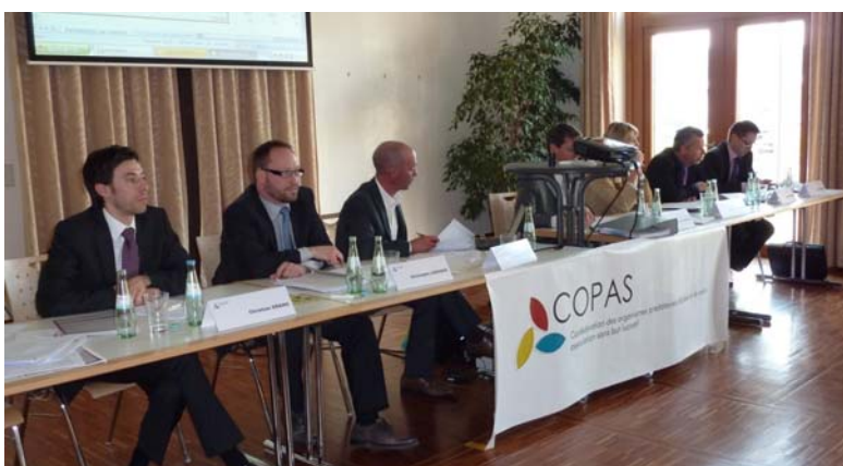
Assemblée générale ordinaire du 24 mars 2011