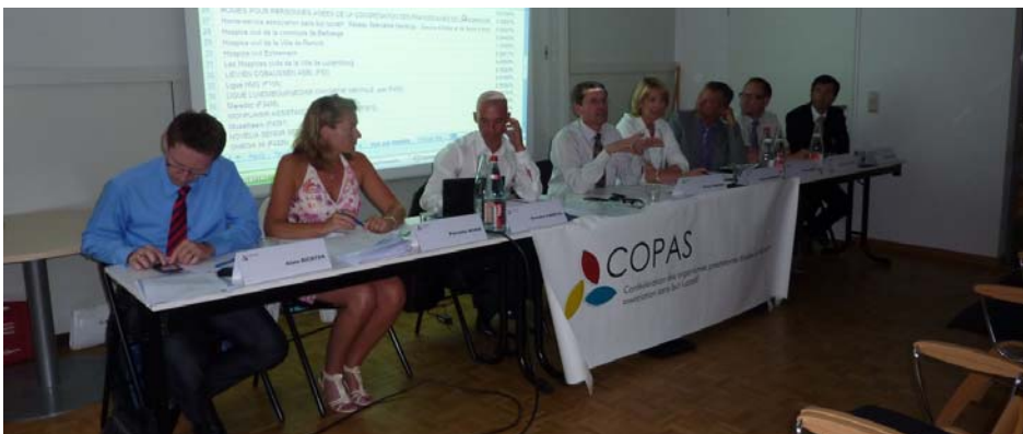
Assemblée générale extraordinaire du 10 mai 2011