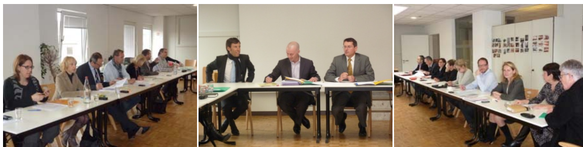
Conseil d'administration 2011